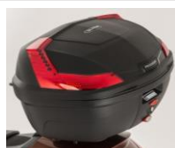
47l kufr černý