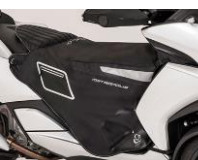
Plachta na nohy