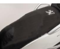
Potah na sedlo