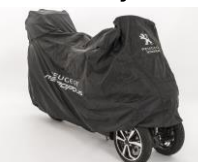
Plachta na skútr