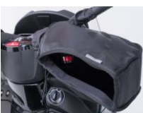
Návleky na ruce