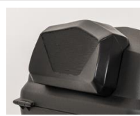
Opěrka pro 47l kufr